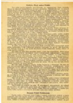
Testament Polski Walczącej (s. 2)