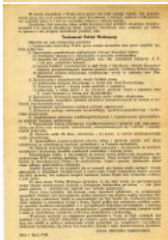
Testament Polski Walczącej (s. 4)