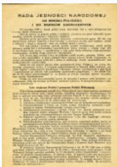
Testament Polski Walczącej (s. 1)