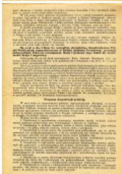
Testament Polski Walczącej (s. 3)